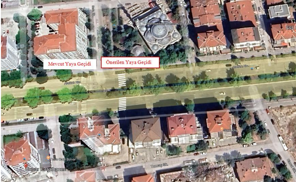
Şekil 2. Atatürk Bulvarı Sami Ramazanoğlu Camii önü mevcut ve önerilen yaya geçidi.

Yapılan ön incelemede; talep yerinin, Ali Fuat Güven Caddesinden Mustafa Kemal Atatürk Caddesi istikametinde otobüs durağına isabet etmesi nedeniyle yaya geçidinin aşağıdaki uydu görüntüsünde (Şekil 2) belirtilen yere (Mustafa Kemal Atatürk Caddesinden Ali Fuat Güven Caddesi istikametinde yavaşlama uyarı çizgileri arasına; Ali Fuat Güven Caddesinden Mustafa Kemal Atatürk Caddesi istikametinde otobüs durağı bitiş noktası öncesine) alınmasının uygun olduğu değerlendirilmiştir.