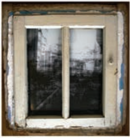
Ergin Soyal Birincilik Ödülü Bana Gidelim mi!