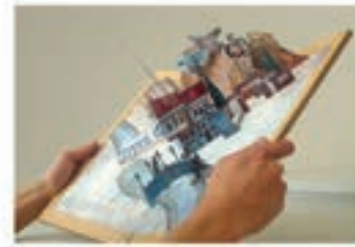
Burhan Bulğç Mansiyon Ödülü Masal Şehri