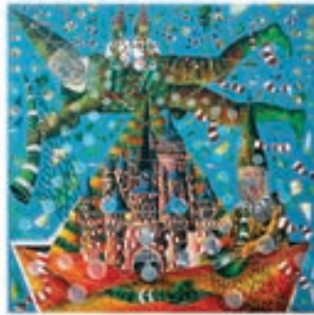
Tamer Derican Mansiyon Ödülü Masal Şehrine Yolculuk