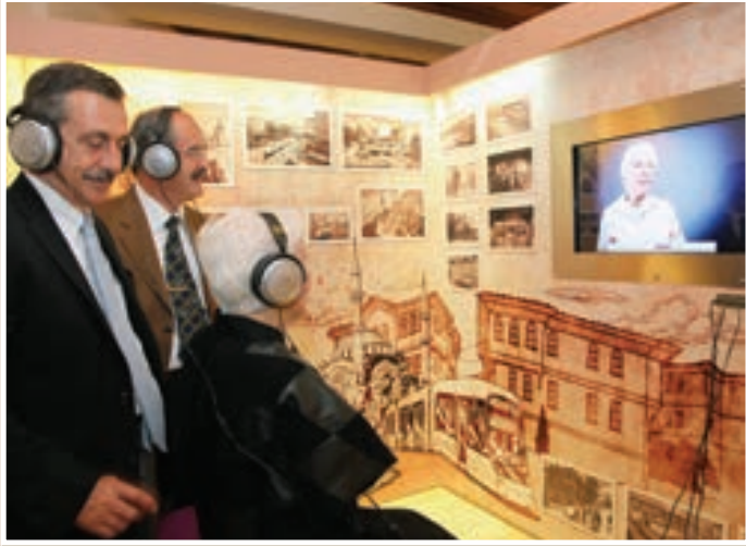
Açılışın ardından konuklar Eskişehir Kent Belleği Müzesi'nde yer alan sözlü tarih çalışmalarını büyük bir ilgi ve beğeniyle dinlediler.