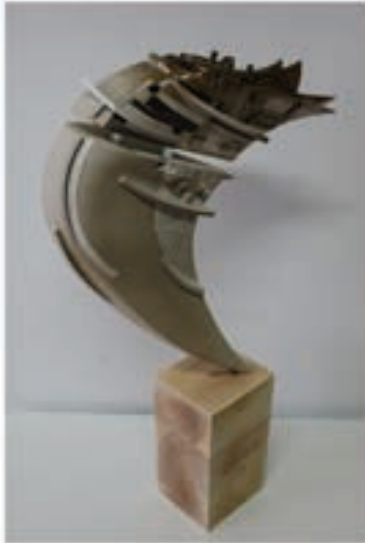
Kamuran Ak Birincilik Ödülü Yükseliş