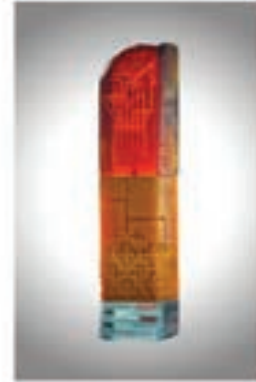
Raif Toplu Mansiyon Ödülü Sentez