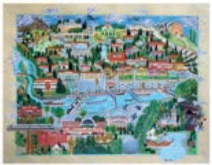
Vildan Gümsöy Mansiyon Ödülü Geçmişten Geleceğe Eskişehir