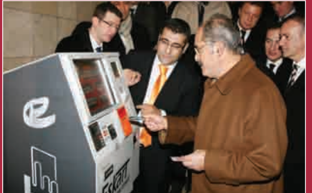
İlk olarak Başkan Büyükerşen'in örnek cihaz üzerinde kullandığı Esparacard'ın tanıtım toplantısında ayrıca mevcut Eskartlara otomatik yükleme yapabilen cihazlar da tanıtıldı.