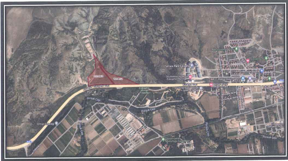
Şekil:1 Planlama Alanının Uydu Fotoğrafındaki Konumu

Söz konusu parseller 1/5000 ölçekli nazım imar planının I24-c-04-b nolu paftasında yer almaktadır. Parseller şehrin batısında Eskişehir-Kütahya Karayolu üzerinde bulunmaktadır. (Şekil-1)