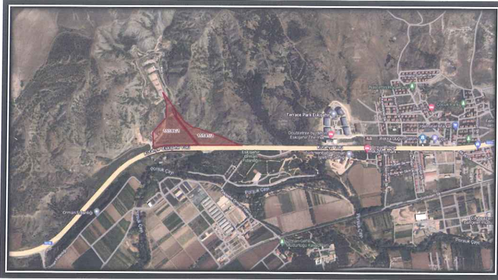
Şekil:1 Planlama Alanının Uydu Fotoğrafındaki Konumu

Söz konusu parseller 1/25000 ölçekli nazım imar planının I24B-3 ile I24C-2 nolu paftalarında yer almaktadır. Parseller şehrin batısında Eskişehir-Kütahya Karayolu üzerinde bulunmaktadır. (Şekil-1)