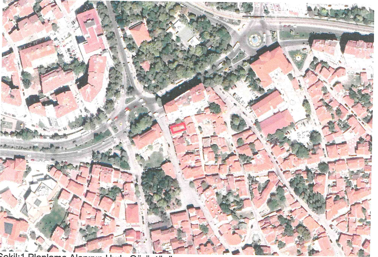
Şekil:1 Planlama Alanının Uydu Görüntüsü

Plan değişikliği teklifine konu olan alan ; Eskişehir ili, Odunpazarı ilçesi, Akcami Mahallesi,tapunun 12887 ada,1 nolu parselinde kayıtlıdır. Alan Odunpazarı Belediye sınırları içinde bulunmaktadır.1 nolu parselin büyüklüğü 138,24 m2'dir.Mülkiyeti Anadolu Üniversitesi'ne aittir.Odunpazarı Kentsel Sit Alanı içinde kalmakta olup,1/5000 ölçekli Nazım İmar Planının 20N nolu paftasında yer almaktadır.Nazım imar planında Ticaret Alanı kullanımı bulunan alanlar içindedir.Sit Alanının kuzeyinde Kurşunlu Cami Sokak ile Şeyh Sadık Sokak köşesinde yer almaktadır (Şekil:1). Üzerinde Anadolu Üniversitesi Konukevi bulunmakta olup ,halen bu fonksiyonla kullanılmamaktadır.