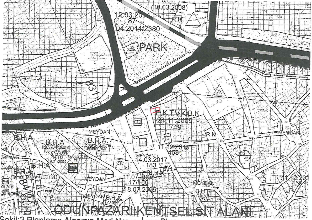
Şekil:2 Planlama Alanının Meri Nazım İmar Planı

Plan Hükümleri doğrultusunda belirlenmektedir.Akcami Mahallesi 12887 ada 1 parselinde kayıtlı olan taşınmaz;Odunpazarı Kentsel Siti içerisinde yer almakta,Gayrimenkul Eski Eserler ve Anıtlar Yüksek Kurulu Başkanlığı'nın 09.05.1981 tarih ve 2808 sayılı kararı ile Korunması Gerekli Eski Eser kayıtlı,Eskişehir Kültür ve Tabiat Varlıklarını Koruma Kurulu'nun 27.07.2011 tarih ve 5067 sayılı kararı ile II.(iki) Grup Korunması Gerekli Kültür Varlığı olarak tescil edilmiş ve tescil kaydı devam etmektedir.