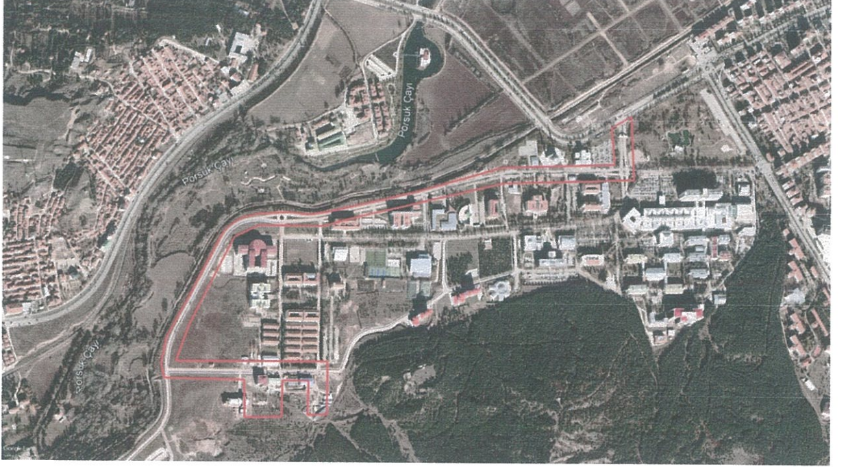
Şekil:1 Değişiklik Teklifine Konu Olan Alanın Uydu Görüntüsü

Osmangazi Üniversitesi Eskişehir Odunpazarı ilçesi sınırları içinde yer almakta olup, kent yerleşiminin güneybatısında bulunmaktadır.