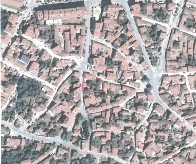
Şekil:1 Planlama Alanının Uydu Görüntüsü

1/5000 ölçekli nazım imar planının 30L paftasında bulunan, İnönü, İsmetpaşa Mahallesi, 433 ada 1-2 ve 3 parsellerin bulunduğu kısım kısmen konut kısmen de park alanı olarak düzenlenmiş durumdadır. 433 ada Meskun Konut alanı olarak planlanmış olup değişiklik sınırları içinde 433 ada 1-2-3 parsellerde 310 m 2 , 245 ada 3 parselde ise 375 m 2 olmak üzere toplamda yaklaşık 685 m 2 konut alanı bulunmaktadır. İmar adasının kuzey kısmında konut parselleri arasında 300 m 2 büyüklüğünde yeşil alan bulunmaktadır. İmar adası batı yönünde 12 metrelik taşıt yoluna, diğer yönlerde ise genişliği sabit olmayan yaya yollarına cephelidir. Alan eski kent dokusu içinde yer almaktadır.