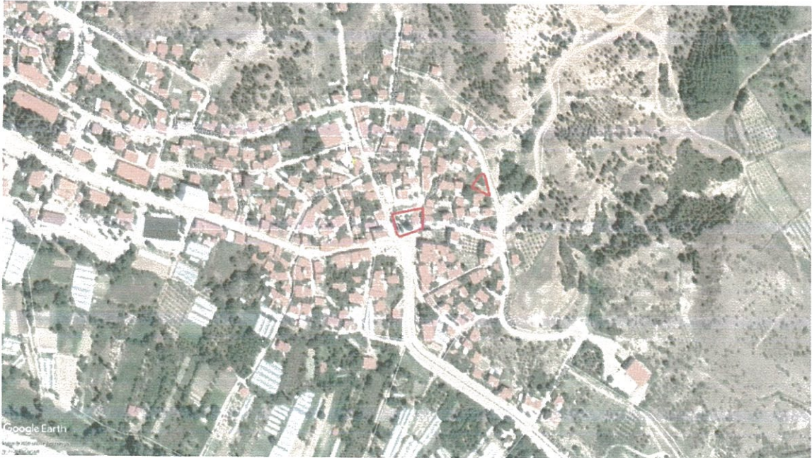
Şekil:1 Planlama Alanının Uydu Fotoğrafındaki Konumu

Nazım imar planı değişikliği teklifine konu olan alan Eskişehir ili, Sarıcakaya Belediyesi,yerleşim alanı merkezinde ,onanlı imar planı sınırları içinde bulunmaktadır. Sarıcakaya Belediye Başkanlığı tarafından yeni hizmet binası yapılması kararlaştırılmış olup,uygun konumda ve Belediye mülkiyetinde bulunan alanlardan birine Belediye Hizmet Alanı (Hizmet Binası) yapılması programa alınmıştır.Bu kapsamda Eskişehir ili,Sarıcakaya ilçesi,Sarıkaya Mahallesinde mülkiyeti Sarıcakaya Belediyesine (Köy Tüzel Kişiliği) ait 470 ada 1 nolu parselde kayıtlı 936.02 m2 yüzölçümlü taşınmazın bir kısmına Belediye Hizmet Alanı (Hizmet Binası) yapılması amaçlanmıştır.Proje çalışmaları ise devam etmektedir.