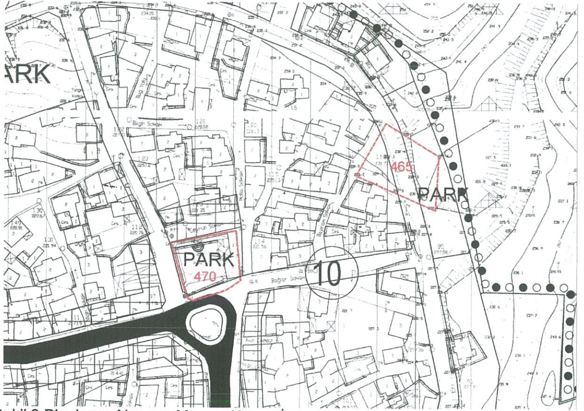
Şekil:2 Planlama Alanının Mevcut Nazım İmar Planı