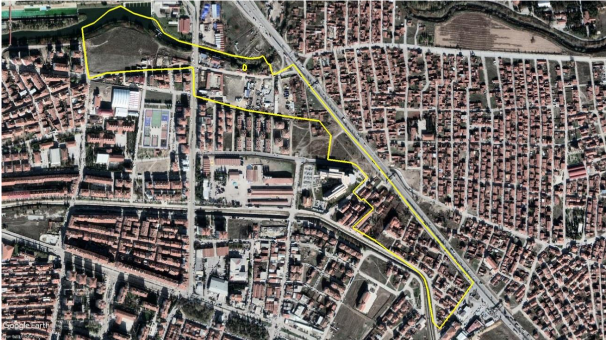
Uydu Görüntüsü Üzerinde Gündoğdu-2 Kentsel Dönüşüm ve Gelişim Proje Alanı

Gündoğdu-2 Kentsel Dönüşüm ve Gelişim Projesi, 5393 sayılı Belediye Kanunu'nun 73. maddesi kapsamında, 11.11.2010 tarih ve 24/390 sayılı Eskişehir Büyükşehir Belediye Meclis Kararı ile belirlenen 20,6 hektar büyüklüğündeki alana ilişkin projedir (Şekil 1).