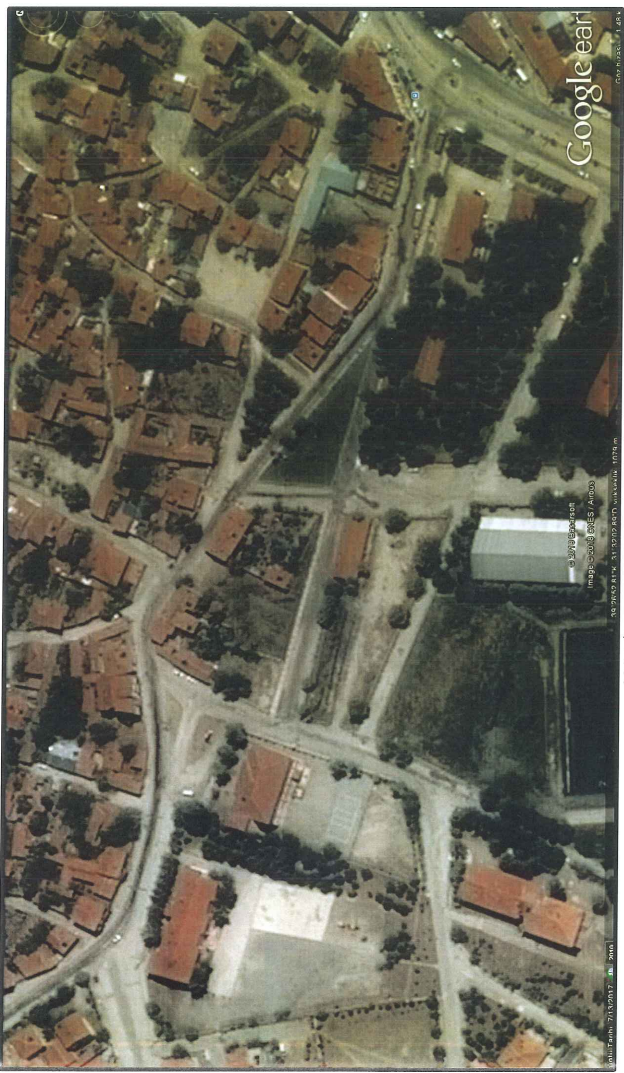
329 ada ve çevresi uydu görüntüsü