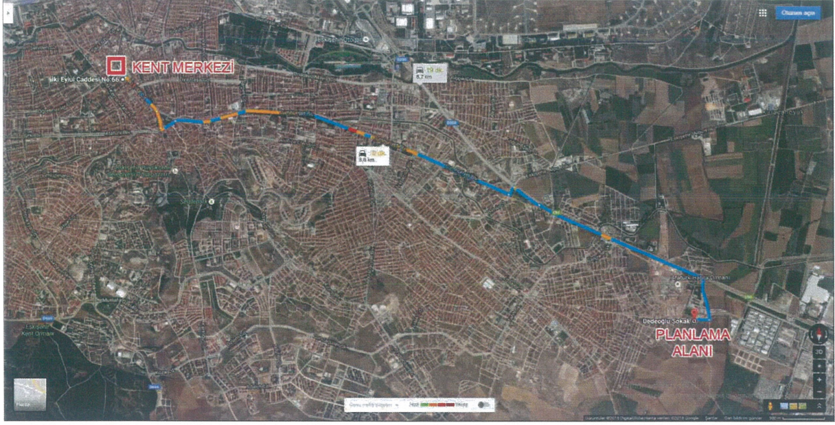
Plana Konu Parselin Konumu

Eskişehir İli, Odunpazarı İlçesi, Sultandere Mahallesi sınırları içerisinde yer alan 2968 parsel, kent merkezine 8,5 km mesafede ve kent merkezinin güneydoğusunda yer almaktadır.