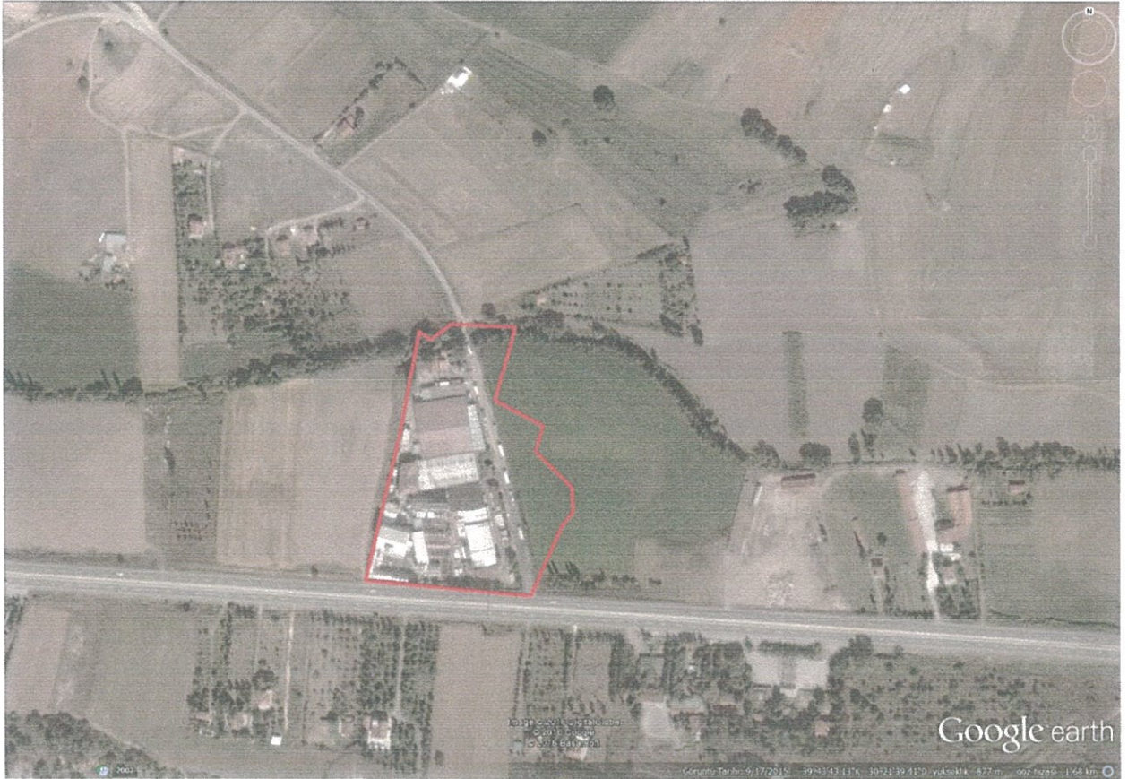
Şekil:2 Planlama Alanının Uydu Fotoğrafındaki Konumu

Planlama Alanı alanı;Eskişehir ili,Tepebaşı ilçesi,Yörükakçayır Mahallesi'nin güneydoğusunda,Eskişehir-Kütahya karayolu üzerinde,karayolundan Yörükakçayır Mahallesi'ne giden tali yolu köşesinde bulunmaktadır.Yerleşim alanı imar planı onama sınırları dışında bulunmaktadır.Alan Tepebaşı ilçesi ve Tepebaşı Belediyesi sınırları içinde kalmaktadır.Planlama alanı,Eskişehir ili,Tepebaşı İlçesi,Yörükakçayır Mahallesi, Katırcı mevkii, I24C-03A4 pafta;13790 ada; 8-9 parsellerinde (eski 15 pafta; 544-545-546-547-548 nolu parseller) kayıtlı olup parsellerin planlamaya dahil olan kısmı yaklaşık 19.075 m 2 'dir.Parsellerin mülkiyeti özel mülkiyette olup Kükre Gıda ve İhtiyaç Maddeleri Nakliyat ve Özel Eğitim Hizmetleri Ticaret ve Sanayi A.Ş.'ne aittir.