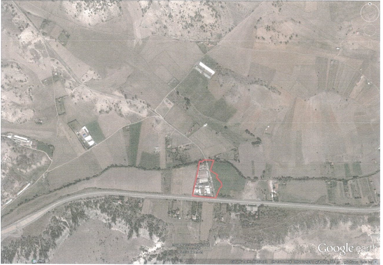
Şekil:3 Planlama Alanının Yakın Çevresi,